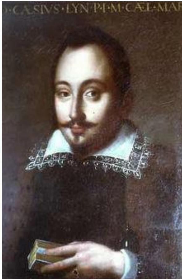
Federico Angelo Cesi