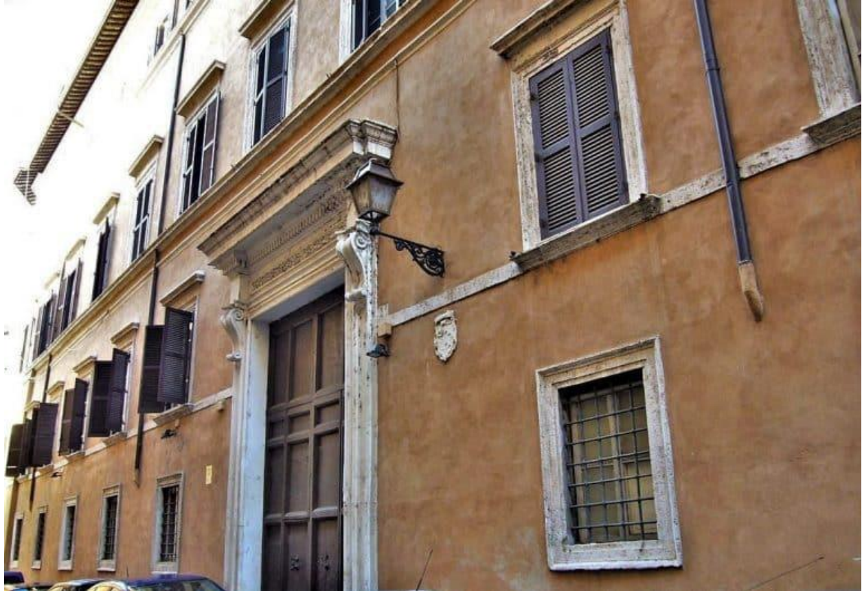
Palazzo Gaddi-Cesi via della Maschera d'Orol

akadeemia põhisuunaks. Seega siis niisugune nimi oli igati sobiv, seda enam, et keskajal arvati ilvest nägevat mitte ainult asjade pealispinda, vaid ka lausa läbi seinte, seega siis asjade sisemust.